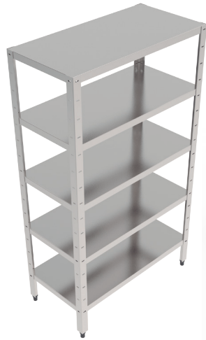
Estante lisa em vários tamanhos.