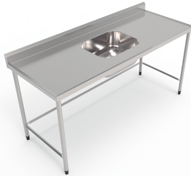
Mesas vincadas com ou sem cuba.